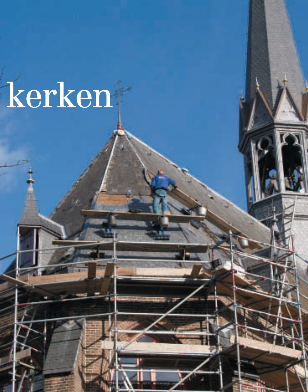
Dakrestauratie van de St. Martinuskerk te Utrecht

bij zo'n 400 middelgrote en grote kerken. Alles overziend, is de minister uitgekomen op € 7 miljoen extra per jaar voor de kerken.